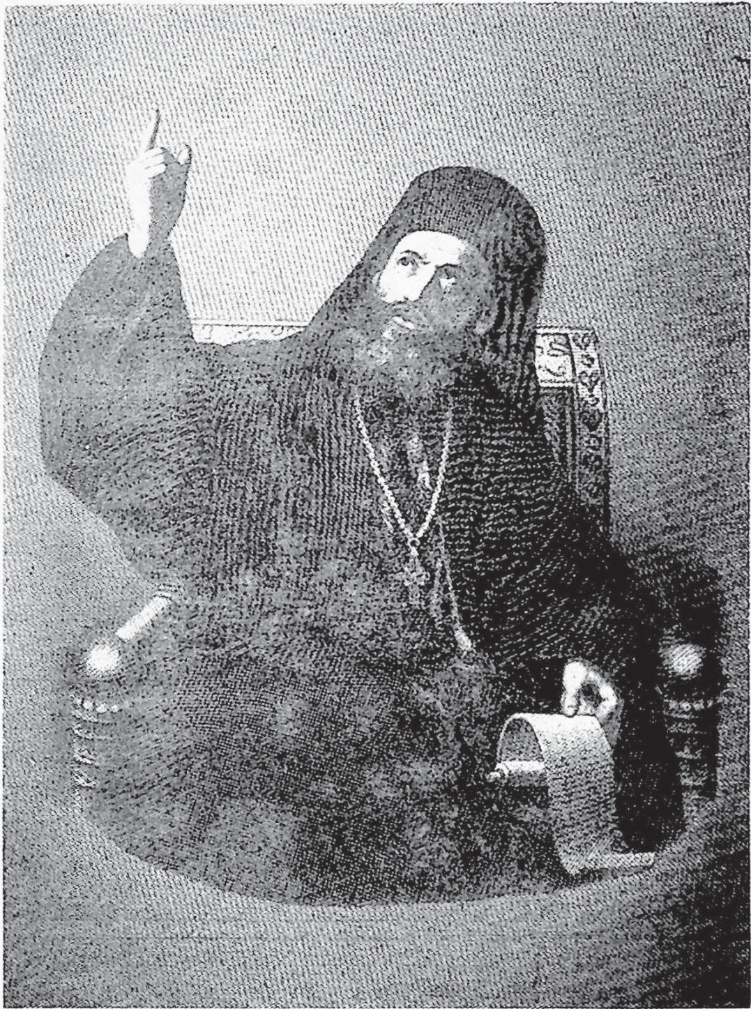
Ὁ Πατριάρχης Γρηγόριος ὁ Ε΄ σὲ μιὰ ἀπὸ τὶς χαρακτηριστικώτερες καὶ πρὸ γνωστὲς ἀπεικονίσεις του.