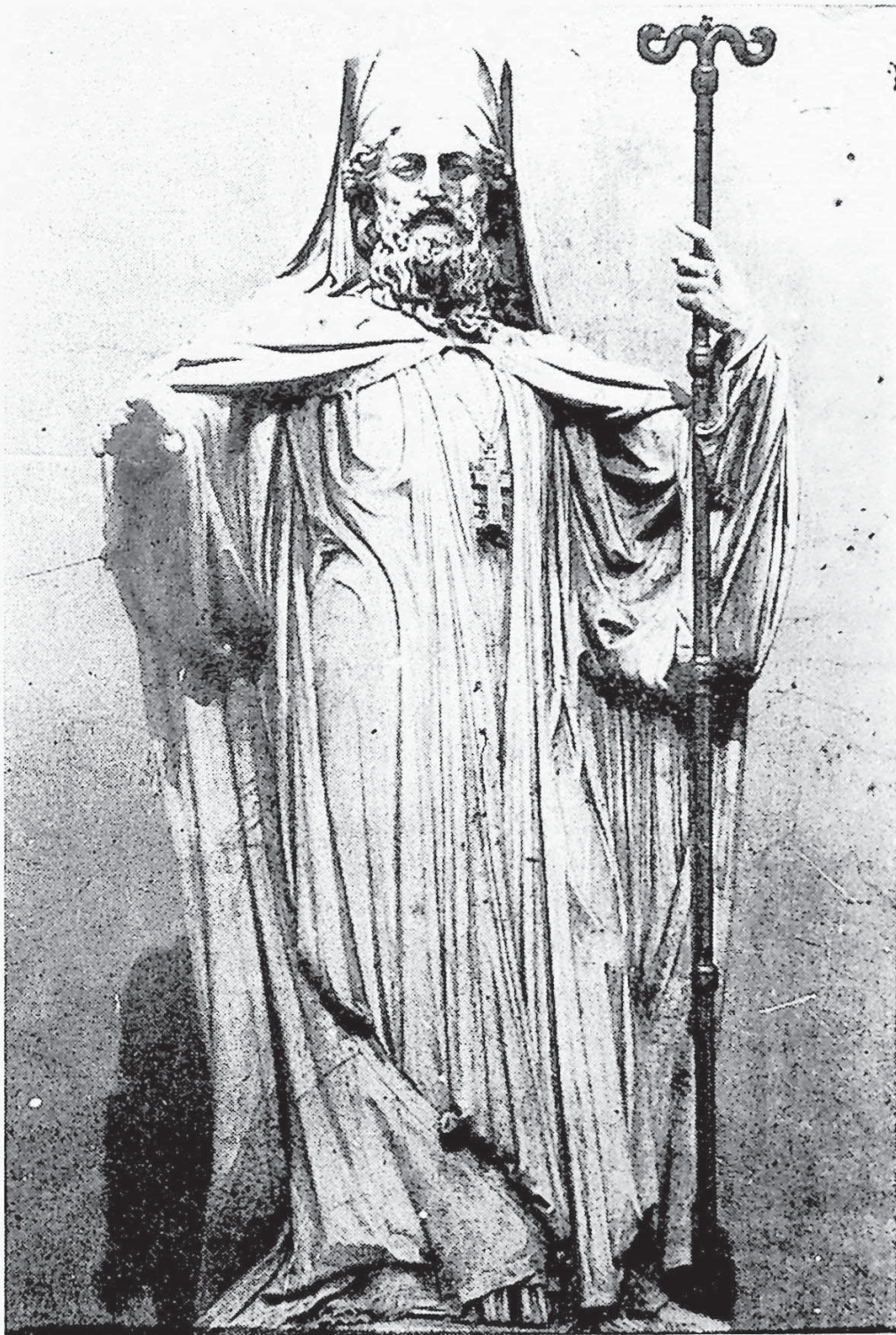
Ὁ μεγαλοπρεπὴς ἀνδριάντις τοῦ ἐθνομάτορος Πατριάρχου Γρηγορίου τοῦ Ε΄, πὸν στολίζει τὸ κεντρικὸ κτίριο τοῦ Πανεπιστημίου Ἀθηνῶν (δεξιὰ ἀπ' τὰ Προπύλαια).