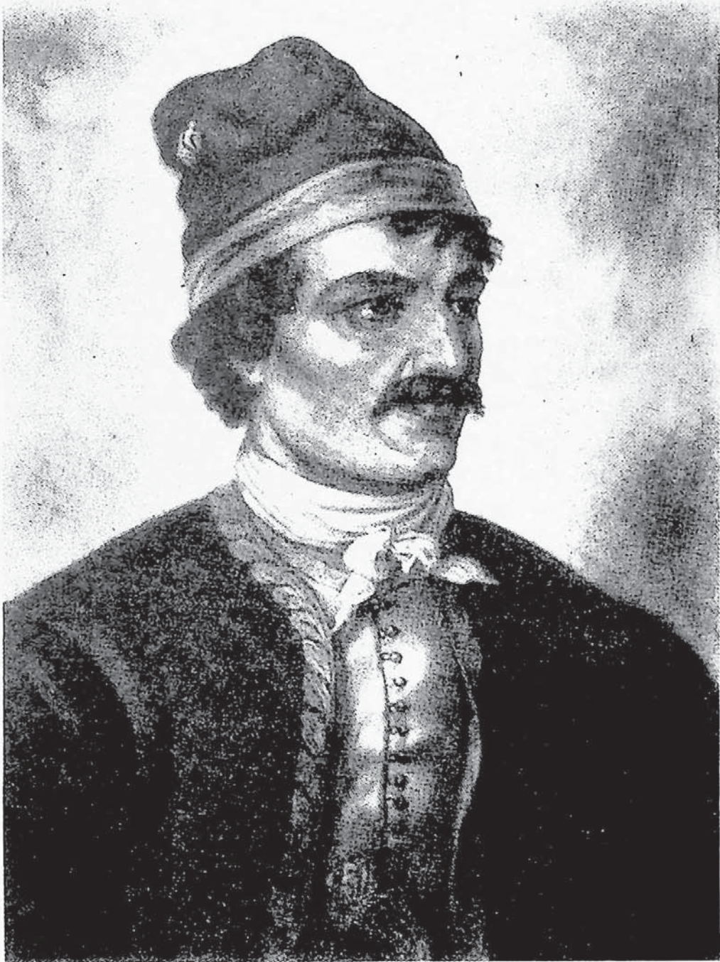
Ὁ ἀτρόμητος πορολόγητης Κωνσταντῆς Κανάρης.