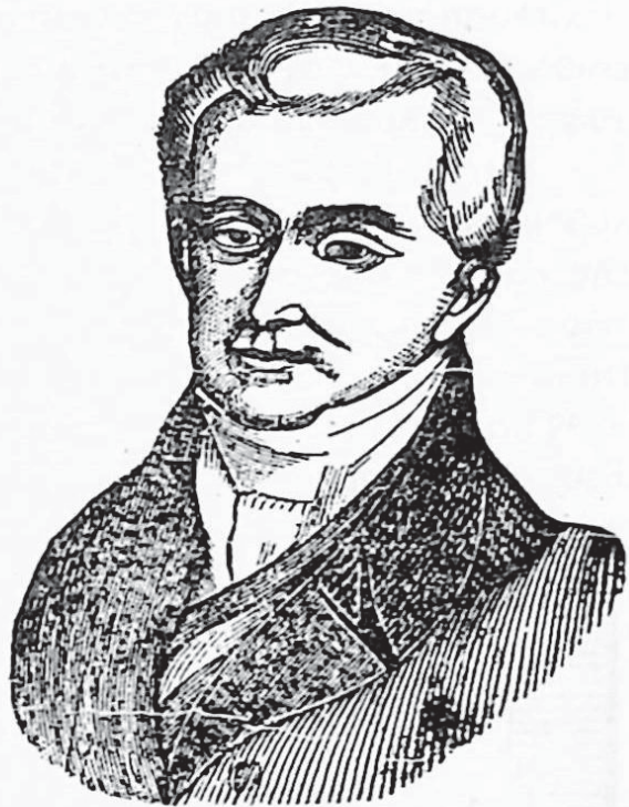
Ὁ Ἰωάννης Καποδίστριας.

Γιὰ νὰ βάλῃ σὲ ἐφαρμογὴ τὶς ἰδέες του αὐτὲς διέλυσε τὴν Ἐθνοσυνέλευση, ποὺ τὸν ἐξέλεξε καὶ διόρισε ἓνα συμβούλιο ἀπὸ 27 ἀνθρώπους, κράτησε δὲ στὰ χέρια του ὅλη τὴν ἐξουσία. Τὰ μέτρα αὐτὰ καὶ ὁ αὐταρχικός του χαρακτήρας δυσἀρέστησαν τοὺς πρόκριτους, τοὺς πλούσιους καὶ τοὺς γαιοκτῆμονες καὶ σχηματίστηκε ἐναντίον του ἰσχυρὴ ἀντιπολίτευση. Σὲ πολλὰ μάλιστα μέρη, ὅπως στὴ Μάνη, ἡ ἀντι-