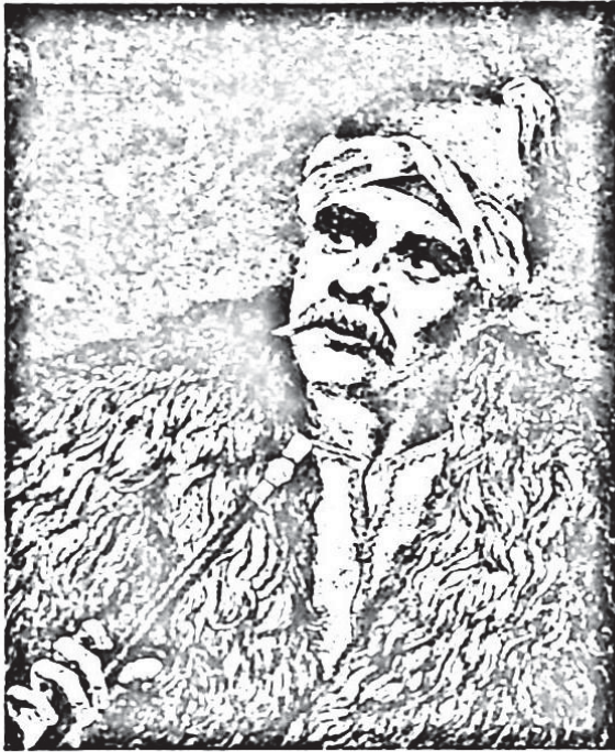
Ὁ Ἀνδρέας Μιαούλης.

να. Ὁ ἐλληνικὸς στόλος εἶχε 80 μονάχα πλοῖα μὲ ἀρχηγὸ τὸν Ἀνδρέα Μιαούλη.