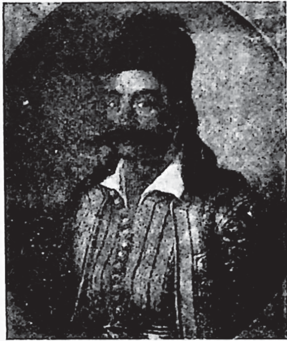
Ὁ Γεώργιος Καραϊσκάκης.

Ὁ Καραϊσκάκης ὅμως δὲν ἀποθαρρύνθηκε. Ἐστειλε τὸ Γρίβα ποῦ χτύπησε τὸ Μουσταφάμπεη στὴν Ἀράχωβα τῆς Βοιωτίας καὶ τὸν ἔκλεισε μέσα στὸ χωριό. Τὴ νύχτα στις 24 τοῦ Νοέμβρη ἔφτασε καὶ ὁ