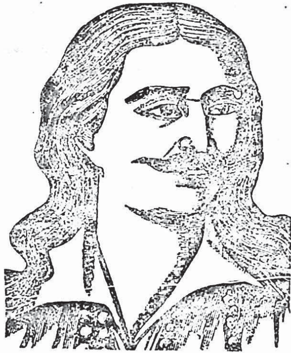
Ὁ Ἀθανάσιος Διάκος.

Ὁ κίνδυνος ἦταν μεγάλος. Ἄν ἔφταναν τὰ στρατεύματα αὐτὰ στήν Πελοπόννησο, ἡ ἐπανάσταση θὰ κινδύνευε. Γι' αὐτὸ οἱ ὀπλαρχηγοὶ τῆς Στερεᾶς Διάκος, Πανουργιάς καὶ Δυοβουνιώτης ἀποφάσισαν νὰ τὰ ἐμποδίσουν καὶ ἔπιασαν τὸ δρόμο ποὺ φέρνει ἀπὸ τὴ Λαμία στήν Ἄμφισσα. Ὁ Πανουργιάς καὶ ὁ Δυοβουνιώτης ὀχυρώθηκαν στὰ ὑψώματα πρὸς τὴν Οἶτη καὶ ὁ Διάκος ἔπιασε τὸ γεφύρι τῆς Ἀλαμάνας πρὸ εἶναι πάνω στὸν ποταμὸ Σπερχειό.